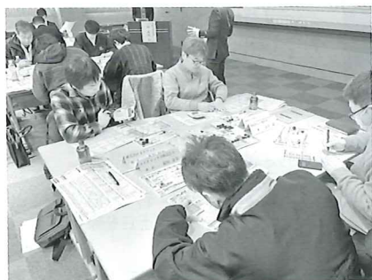
ゲーム研修で戦略を練る様子

方法等を学んだ。参加者からは「決算書は見てもよく分かっていなかったが見るポイントが理解できた」「数字への苦手意識が薄れた」といった感想や「自社の状態を客観的に見られるようになった」「経営判断に数字をどう使えばよいかイメージできた」「もっと早く聞きたかった」といった実務に直結する感想も多く、実践性の高いセミナーとなった。 高度化する多様な経営課題に対応する基礎となる会社数字を理解することで、自社経営を見直す機会となった。 者からは「自ら戦略を立て、数字が変わる面白さを実感した」「経営を自分事として捉えられた」と好評であった。