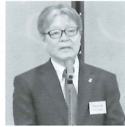
挨拶する石川会頭

当所は1月13日、西尾コンベンションホールにて2026年の新春交礼会を開催した。