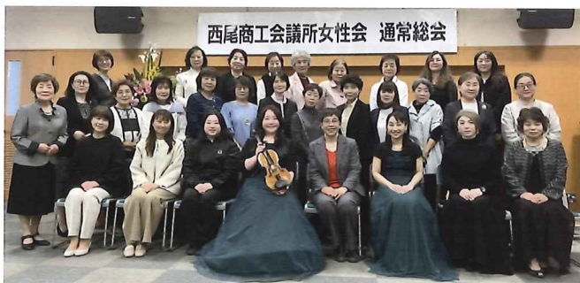
R7 総会后、初の異業種交流会を企画

30年の歴史の上に成り立っています。節目の年を迎え、あらためて「つなぐ」という役割の大切さを感じています。女性会は、世代や業種の垣根を越え、学び、助け合い、地域と共に成長する場として、40周年、その先へと歩みを進めていきたいと考えています。西尾でリアルな横のつながりを作りましょう。