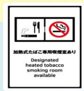
「施設」の 出入口に 貼るもの