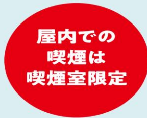
屋内での喫煙には 喫煙室の設置が必要に