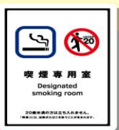
「喫煙室」の 出入口に 貼るもの