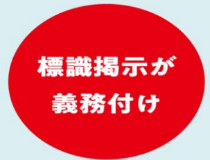
喫煙室には 標識掲示が義務付けに