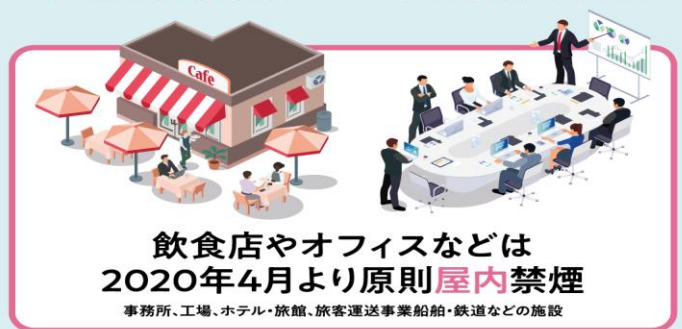
飲食店やオフィスなどは 2020年4月より原則屋内禁煙