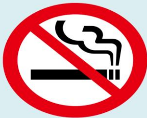
多くの施設において 原則屋内禁煙に

2019年7月から、病院や学校、行政機関で原則敷地内禁煙のルールがスタートしました。そして2020年4月、飲食店やオフィス・事業所などでも、原則屋内禁煙となるほか、20歳未満の方の喫煙エリアへの立入禁止などを加えた改正健康増進法が全面施行されます。