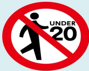
20歳未満の方は 喫煙エリアへ立入禁止に