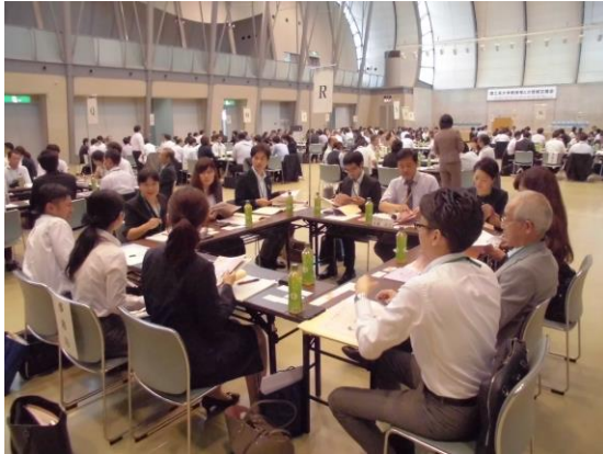
《大学教授を囲んでのテーブル懇談会》