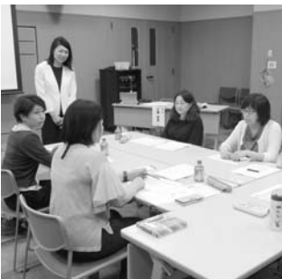
ワークショップ形式で開催

デザインや組織とのコミュニケーション方法を学んだ。参加者からは「今後どうしたらよいか具体的にイメージできた」と前向きな感想があった。