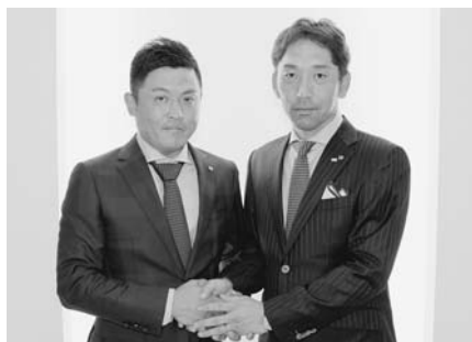
対談を終え握手を交わす二人

来年は直前会長としてバックアップするよ。会員一人一人の声を会長に届けたい。あと他の青年部との人脈が出来たから橋渡し役となって、将来西尾から県連会会長を輩出できるような人材と組織づくりの役に立てるといいな。