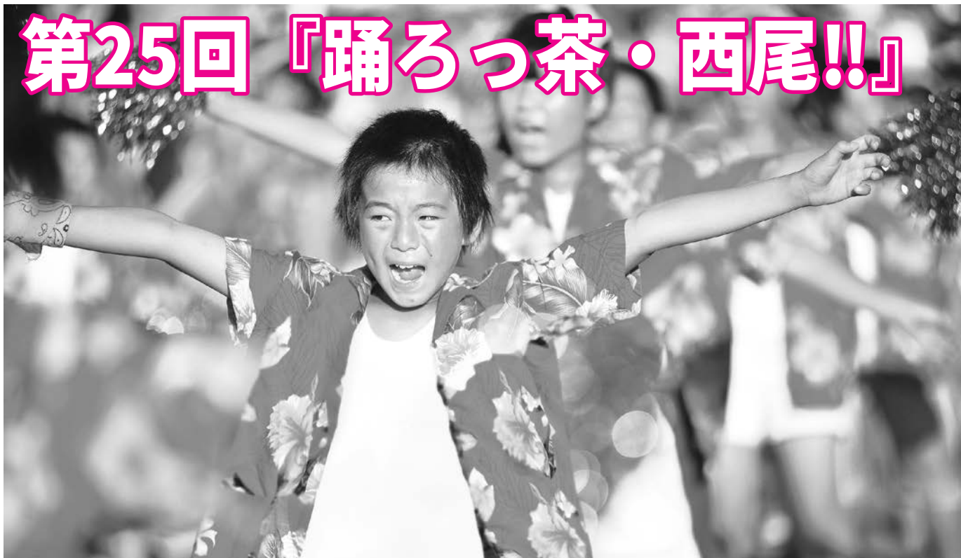
ファイルに綴じて保存してください。