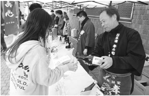
日本酒を楽しむ参加者