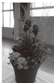
完成した寄せ植え