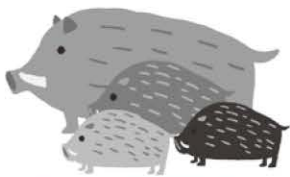
職員4名で猪突猛進!

皆様方のご理解ご支援、ご協力を深くお願い申し上げます。新年のお喜びとご挨拶を申し上げます。