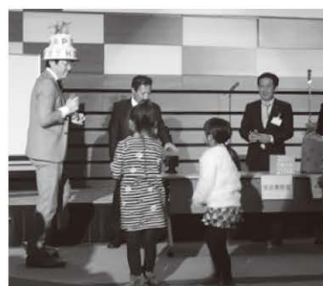
ゲームを楽しむ子ども達