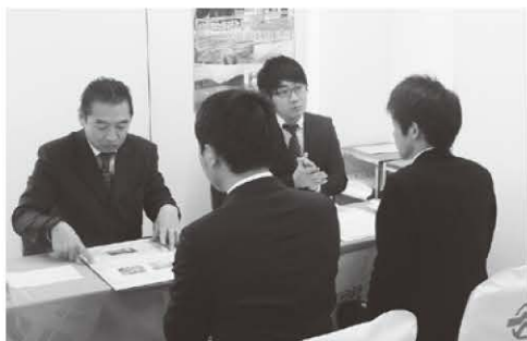
面談をする企業と求職者