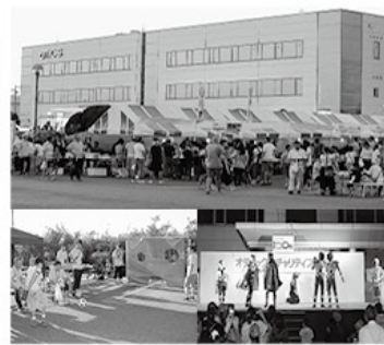
チャリティーフェスタ

地域の皆様とのふれあいを大切に、毎年恒例の夏祭り「オティックスチャリティーフェスタ」の開催、「西尾市中学生リーダー養成塾」の支援や地元小学生の工場見学会など、地域に貢献できる企業であり続ける。