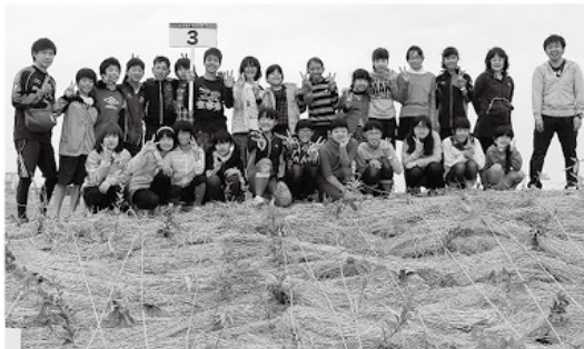
地元の子供たちと森づくり

創業100周年記念事業としてスタートした「オティックスの森づくり」。3回目となる今回は、地域の皆様を含む約540人の方々が参加し、寺津工場に約4000本を植樹した。オティックスが目指す「本物の森」とは、多種類の苗木を植えることで、互いに競争しつつ共存をし、人間の手がなくても長く生き続けられる森。未来の子供たちに豊かな地球を残せるよう、今後も環境活動を続けていく。