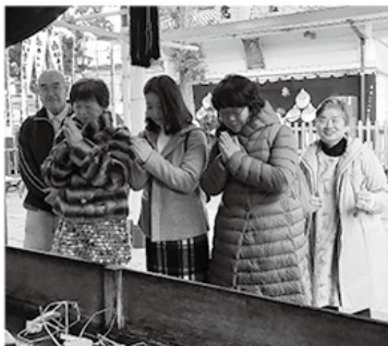
参拝をする参加者の皆様

当所商業3部会は、1月22日(火)、毎年恒例の大人気企画、「商売繁盛!日帰りバスツアー」を開催した。当日は41名が参加し、おちよぼさんの愛称で有名な千代保稲荷で今年の商売繁盛を祈願。昼食に和牛の食べ放題を堪能した後、彦根城と美濃の舎の散策を楽しんだ。