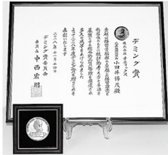
デミング賞の賞状とメダル

「和と努力」を社是とし、「明るく元気で楽しい職場」が合言葉。厳しくなる経営環境の変化に対応するため、2014年にTQM(総合的品質管理)強化を宣言。全社一丸となりQC手法を学習し、全社員の半数以上がQC検定に合格。更に2018年にはTQMに関する世界最高ランクの「デミング賞」に挑戦した。全社で重ねてきた改善の成果や本