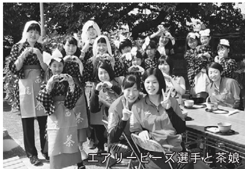
エアリービーズ選手と茶娘

5月27日、西尾市を本拠地にするデンソーエアリービーズの選手ら28名が、上町の稲荷山茶園公園で茶摘み体験などを通じて西尾の茶文化について理解を深めた。