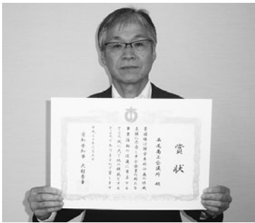
表彰状をいただきました

6月5日に名古屋商工会議所で開催された愛知県商工会議所専務理事会議において、当所が愛知県より経営革新計画作成支援優良団体として表彰を受けた。 平成29年度の経営革新計画の作成支援件数が12件であり、経営指導員一人当たりの作成支援件数で県下一位であった。