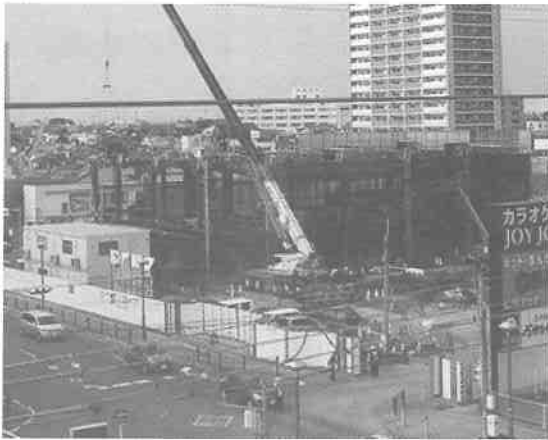
西尾駅前に骨組みが見えてきました