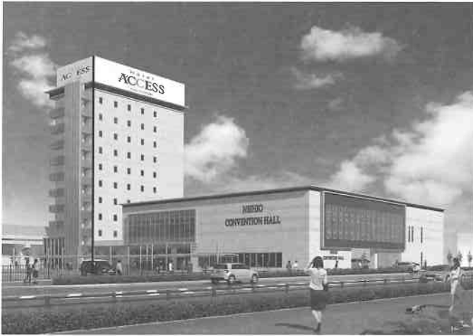
コンベンションホール完成イメージ

西尾市が2001年12月に着手した西尾駅西地区の再開発事業が、紆余曲折の末、16年の歳月を経て、2018年10月のコンベンションホール開業に向け、今月から着工します。