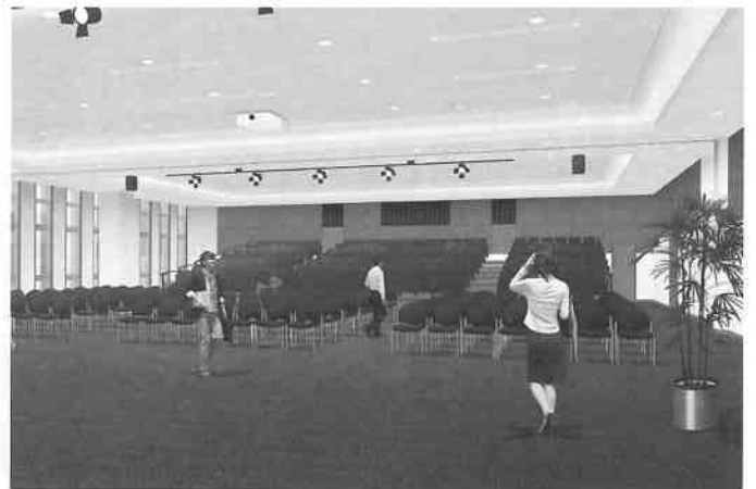
コンベンションホール内観イメージ

西尾市民の文化的催事や芸術的接点として、また産業界においては総会・周年行事の他に展示会、商談会、見本市等開催可能な場となります。大ホールは最大450名様収容(約500㎡)、3分割可能な多目的ルーム(会議室)を有しています。祝宴