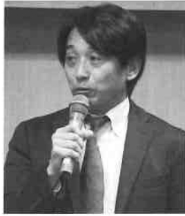
講演する片山右京氏

9月21日、当所大ホールにて元F1レーサーの片山右京氏をお招きし、講演会を開催した。自身の経験からチャレンジする大切さを語り、参加者189名が耳を傾けた。