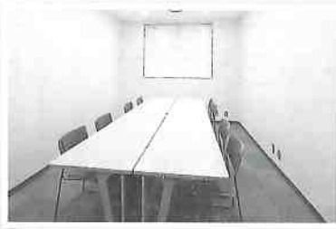
3階テナント①(17.93㎡) ※備品の設置はありません

テナントとしてご利用可能な部屋が2室ございます。 (左写真参考) 条件・詳細はご相談ください。