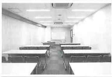
3階テナント②(44.26㎡) ※備品の設置はありません