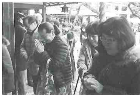
参拝をする参加者の皆さん