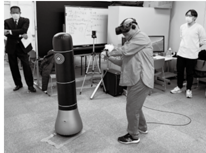
VR 野球体験している様子