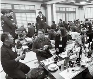
交流を楽しむ参加者

参加者は、「先輩方の仕事に対する熱意を聞き、改めて勉強になった」「お会いしたことのないOB・OGと繋がることができ良かった」と語った。