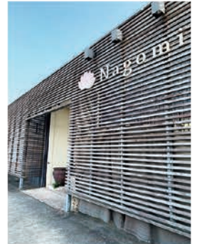
戸ヶ崎町にあるお店