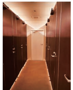
完全個室ロッカー

岩盤は「貴宝石」を使い、質やサイズ、季節に合わせた温度調整は特にこだわり、隣り合う岩盤のミゾは浅く清潔感を保ちやすい施工がされています。完全個室ロッカー、手ぶらで来店できるようタオルや作業衣も貸出可能。快適に利用して頂くためにタオルは日中、頻繁に洗濯して天日干しを心掛けていることも人氣が高い理由のひとつです。