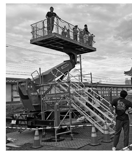
青年部主催のイベント

開催1日目は、「1000人BINGO」が行われ、2日目には、神輿渡御が行われた。3日目には、昨年リニューアルされた「市民総踊りおどりん西尾!!」が開催され、3日間総勢約30万人が祭りを訪れ、