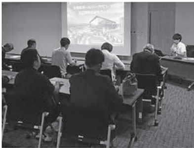
説明を熱心に聞く参加者のみなさん