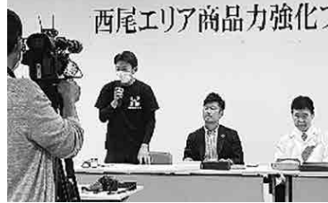
一社ずつ、完成した商品を披露しながら、特徴・魅力を発表した。