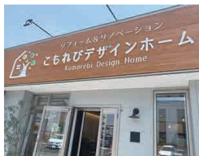
今川町にあるお店