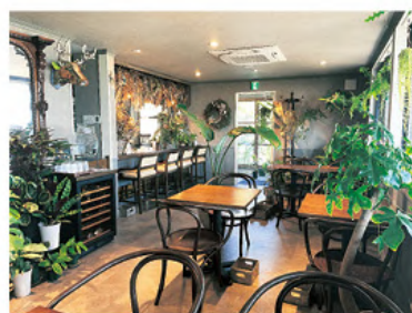
アンティーク家具が揃う店内

2022年8月4日、海が良く見える丘の上にランチカフェ、ダイナーなどで海を眺めながら贅沢な時間を過ごすことができる、緑豊かなカフェをオープンさせた。店内はアンティークチェアやテーブルで大人な空間を築しめ、店舗入口から店内まで多くのボタニカル(植物)に囲まれる。