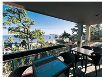
宮崎の絶景が楽しめるテラス席

「飲食経営は、死ぬまでやっていきたい。年に一回でもいい、記念日等に利用していただけるような、常連様に長く愛される飲食店経営をしていきたい」とにこやかに話された。