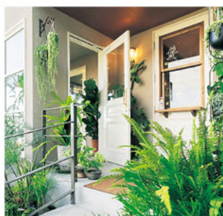
緑豊かなエントランス

2022年8月4日、海が良く見える丘の上にランチカフェ、ダイナーなどで海を眺めながら贅沢な時間を過ごすことができる、緑豊かなカフェをオープンさせた。店内はアンティークチェアやテーブルで大人な空間を築しめ、店舗入口から店内まで多くのボタニカル(植物)に囲まれる。