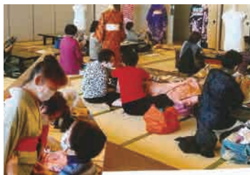
着付け講習会の様子

明治8年、髪を「結う」時代から「切る」時代が始まり、過去の先輩たちが模索しながら、昭和32年に美容師法が生まれました。法律に基づき美容を行うため、美容組合が重要な役目を担うようになりました。しかしながら平成に入ると適正化規定が廃止され美容組合は営業時間や料金、休日などの決定権がなくなり、組合の存在が以前よりも薄れてきています。