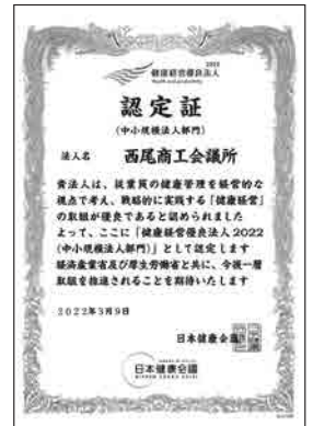
【当所の健康経営2022認定証】