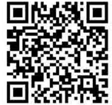
【健康経営ポータルサイト】 ※申請や詳細はこちらから