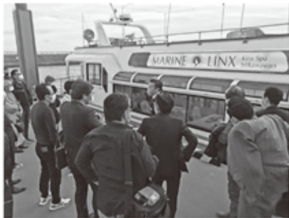
マリンリンクス号の話聞く参加者

その後、昨年10月に就航した「マリンリンクス号」について、三河湾リゾートリンクスの担当者より話を伺った。波の状況により出航できず船内見学のみとなったが、同社