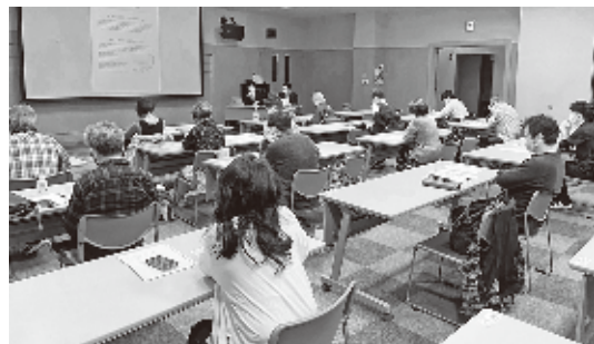
編集作業に向け真剣に学ぶみなさん

当所は10月26日、「動画作りセミナー」を開催した。当日は16名が参加。「みてみん西尾」の運営会社であるブリ・テック(株)社員を講師に招き、あらかじめスマホで撮影してきた動画を素材に実際に編集作業を体験。複数の動画を繋げ好みの長さでカットする作業をはじめ、文字やBGMの追加等、スマホの無料アプリを利用することで簡単に動画編集ができることを学んだ。