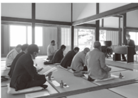
本堂にて講演される様子

当日は、実相寺の歴史に触れながら境内を案内頂いた後、本堂で講演いただいた。吉良氏について関係系図と合わせ、あまり知られていない歴史に触れながら説明をいただいた。参加者はとても興味深