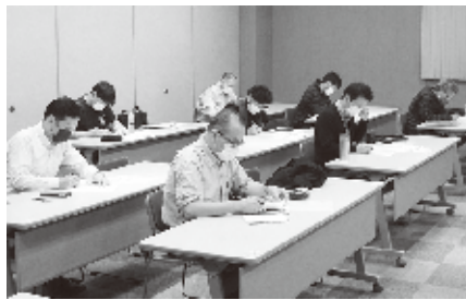
熱心に経営分析をする参加者

参加者からは「実践的な内容であり、何をすれば安定した収益を確保する事が出来るのか明確になった」と語った。