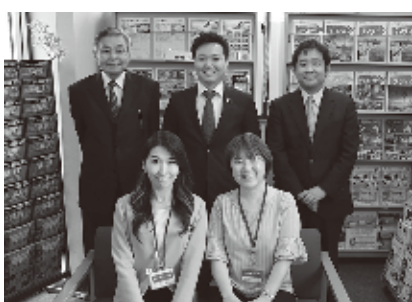
社員一同、お待ちしております

また、会議所や観光協会さんと共に西尾市の観光を盛り上げる活動にも更にかかわっていきたいと思います。そして父の誰にも負けない「熱い思い」を引き継ぎつつ、自分の色を出しながら様々な事にチャレンジしていきたいです。