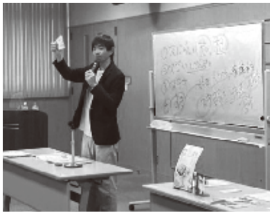
心に残る販促グッズを提案