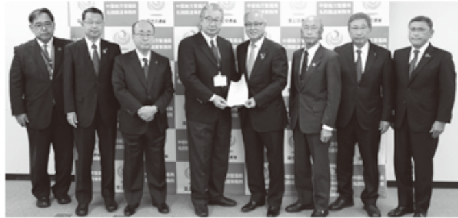
名四国道事務所への要望

高速道路のない西尾市は、国道23号線・名豊道路が重要路線である。今回要望では、西尾東ICから幸田芦谷ICの渋滞改善のため、早期4車線化の工事着手を要望。また、未開通区間である蒲郡ICから豊川為当ICの早期工事着手も要望した。 名四国道事務所からは、令和6年度に国道23号線・名豊道路が開通予定との発言をいただいた。