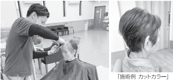
「施術例 カットカラー」

自分で美容室に行けない方向けに、施設や自宅などへ訪問する移動美容室です。作業的にカットをするのではなく、シャンプー、パーマのサービスも行い通常的美容院のように様々な髪形を選んでいただけるようにしており、「いつまでも美しく」を叶える店を目指しています。