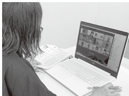
オンライン情報交換会の様子

参加した企業担当者は、「コロナ禍における学生の就職活動の動き方や、大学の就職指導の状況などを伺うことができた。今後も大学との連携を深めたい」と語っていた。 当日はグループでの情報交換や、企業と大学が1対1で話すことができる個別面談会を実施した。 西三河地区の6市(安城、岡崎、刈谷、豊田、碧南、西尾)の商工会議所及び各市の雇用対策協議会は9月7日、オンラインにて「理工系大学教授等との情報交換会」を開催した。6市の中小企業など、75社の採用担当者らが参加し、大学は東海、近畿地方などから16大学25名が参加した。