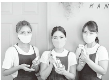
最高のスタッフがお待ちしております

コロナ禍でも順応するだけでなく、利用するといった気持ちで活動していけたらと思います。