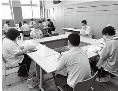
情報交換会の様子

当事業は企業と高校の就職に関する情報や人材確保等の情報交換を目的としている。昨年は新型コロナウイルスの影響により中止したが、今年是对策を行い開催した。参加した企業の担当者は、