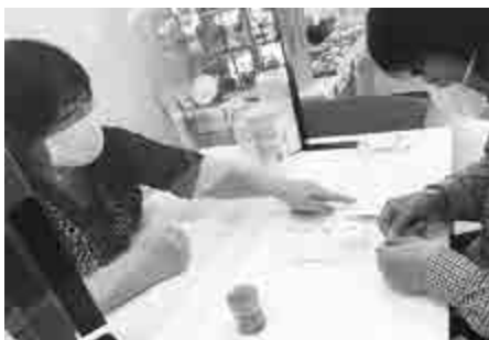
マスクアクセサリーの制作（どれいぶ）

参加した事業所からは「参加されたお客様の再来店があり、商品のお買い上げがあった」「ふれあい教室後、すぐに製作注文がはいった」などの声があり、大好評であった。