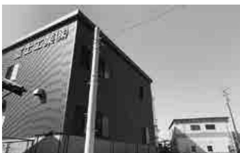
下町にある富士工業(株)

会員増強に力を入れ、仲間同士をお互いに高め合う事、また、西尾の外に目を向け、日本商工会議所青年部としてのスキルメリットを生かした活動をしていきたいです。