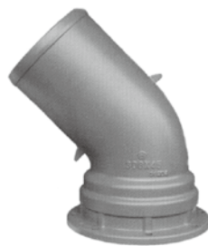
生産量日本一のダクティル異形管

企業理念「先進技術とCSR経営で铸铁異形管のリーダーカンパニーとして潤いのある社会生活に貢献し続けます。」を掲げ、当社に関わる全てのステークホルダーと円滑円満に铸件製品を通じて社会に潤いを与え続けられる企業になるべく歩んでいく事を明確に示しました。目まぐるしく変わる環境変化に対応し、ぶれない事、組織で常に作業継承が継続される事、新しい製品や事業に挑戦する環境作りをC I見直しで行っていく事が目標です。