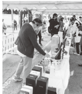
酒フェスタの様子

とだが、中止することは簡単でも、どのように対策、準備をすれば開催できるかを考えることが大切である。WIT Hコロナ時代はまだまだ続くが、へこたれず、前向きにがんばっていききたい」と語った。