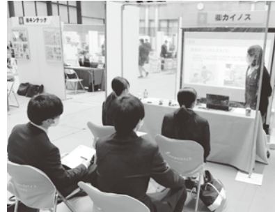
企業ブースの様子

I-T導入補助金は、生産性の向上に資するI-Tツールを導入する為の事業費等経費の一部を補助し、企業の生産性を向上させることを目的とした補助金である。申請数、採択数全国最多の実績を誇る