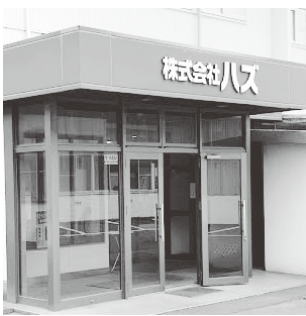
新しくなった会社外観

最後になりますが、铸件製品を通じて社会に貢献し続ける企業であるため社員一同一つになって邁進してまいりますので、今後とも宜しくお願い致します。