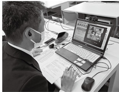
オンライン説明会の様子

ツールながらも有意義な時間となった。ここでの出会いを採用に繋がりたい」と語った。