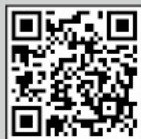
参加申込フォーム