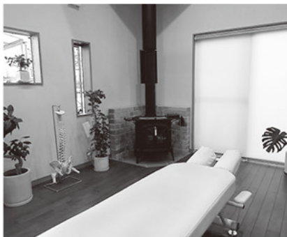
整理整頓が行き届いた室内

100%手技にこだわっています。バキバキするような矯正は一切しません。軟組織といわれる筋肉・筋膜・靭帯などに対してアプローチしていくことが施術の中心となってきます。