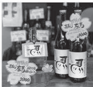
お花見にぴったりの1本！ オリジナルラベルやラッピングもできます！